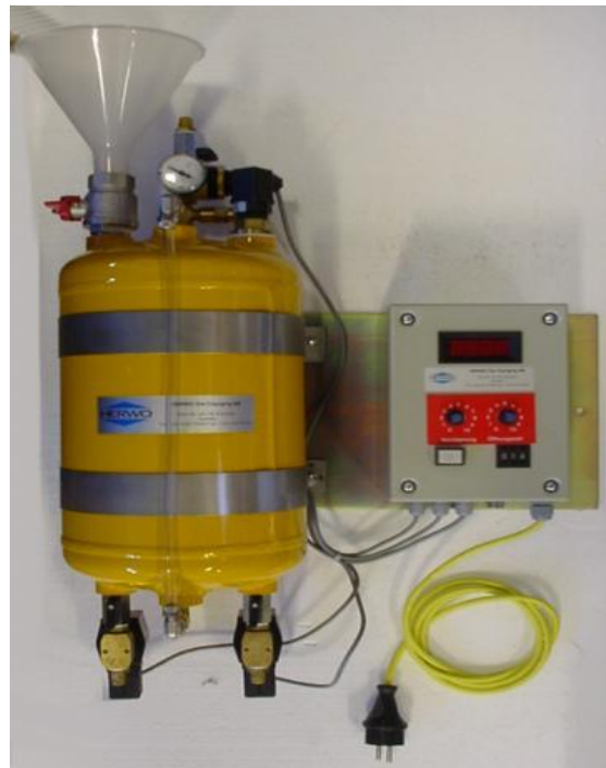
Ovan: Modell DOS 10

Smörjmedelsbehållarens syfte är att dosera ut exakt rätt mängd, vid rätt tillfälle. Herwos utrustningar är anpassade till press verkstaders miljö, och är därför mycket underhållsfria och tåliga.