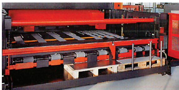
Utmatarenhet EVR försedd med staplingsenhet ENC